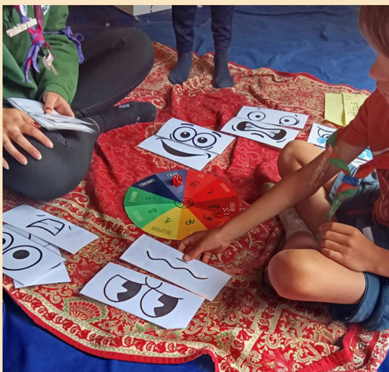
Les jeux sur les émotions (outils Marchepied).