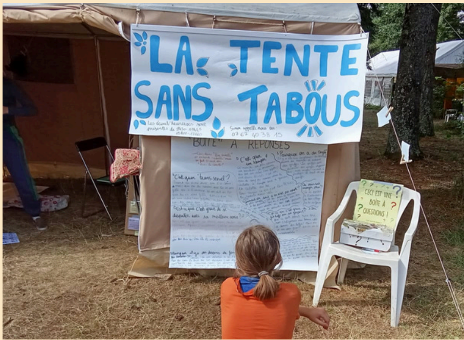
L'entrée de la tente, la boîte aux questions et le mur des réponses.